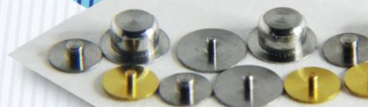
Photo Tool Pin

フォトツールピンの他に、ホックピンやボタンピンといった呼ばれ方をする場合があります。薄い形状が求められるため、高い加工技術が必要な製品です。